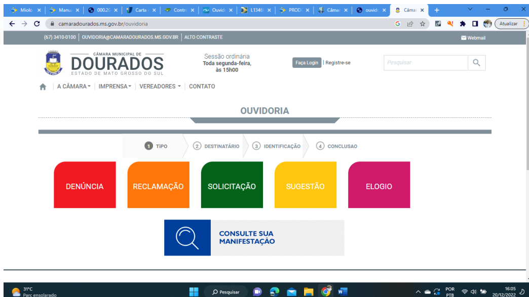
Imagem 01. Ouvidoria da Câmara Municipal de Dourados - MS